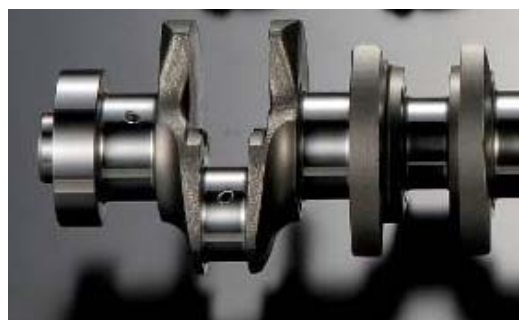
フルカウンターながら、超軽量化を施したクランクシャフト